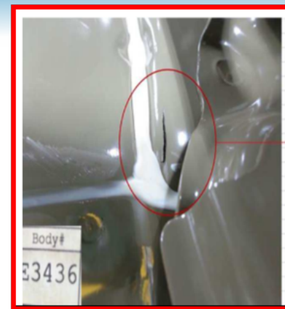
Figura 1. Operação de Repuxo – Defeito de ruptura (trinca)

Devido aos resultados positivos obtidos em diversos trabalhos, a demanda e o emprego de simulações aumentou consideravelmente, surgindo a